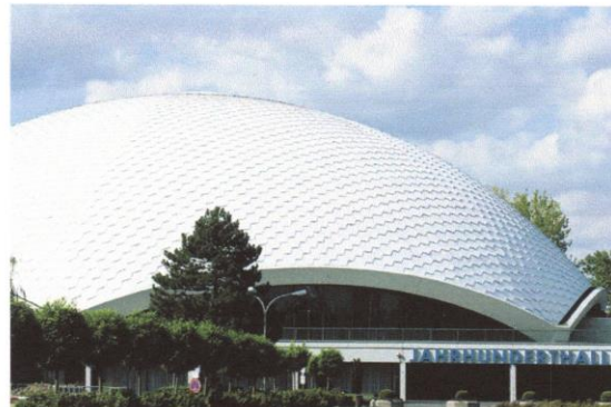
Jahrhunderthalle in Frankfurt Höchst

Diekmann den österreichischen Markt angehen. Danach könnten Skandinavien und Polen an der Reihe sein.